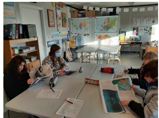
Leesstrategieën toepassen op een krantenartikel.

WERKSTUK: opstart werkstuk Grieken en Romeinen.