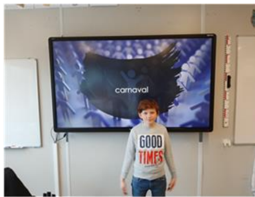
WEETJESKRING LÉON: carnaval.