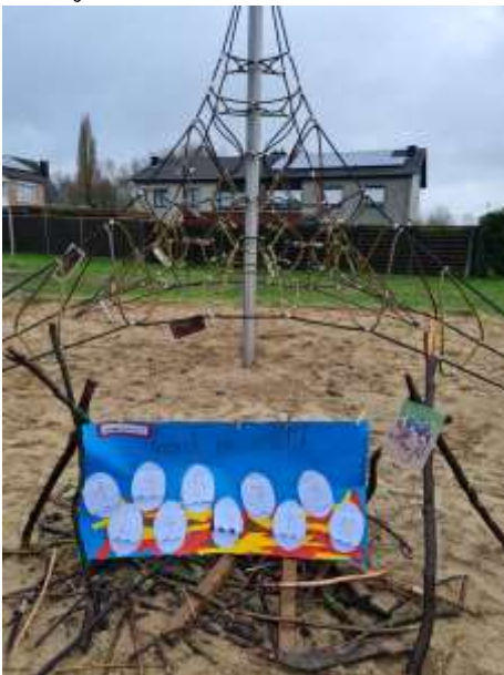
het werk van L1