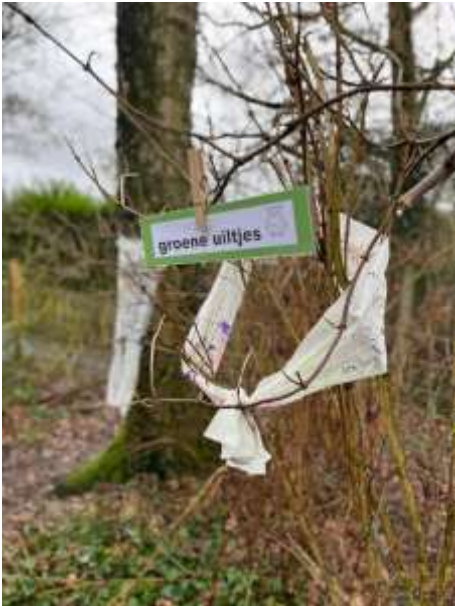
het werk van de groene uiltjes