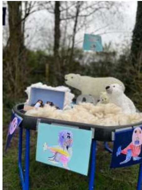
het werk van de roze uiltjes