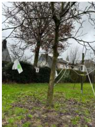
het werk van de wolven.