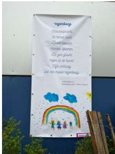
het werk van L2