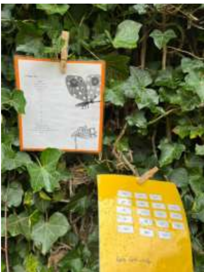
het werk van de vossen.